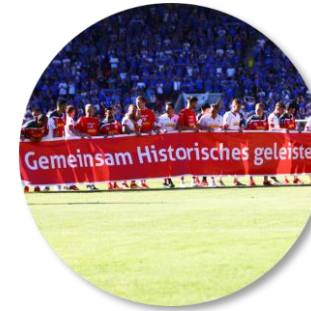
Sportlich erfolgreichste Zeit der Clubgeschichte