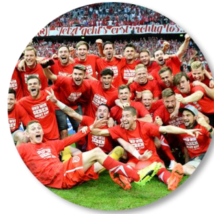
Erfolgreicher Aufstieg in die 2. Bundesliga im Mai 2017