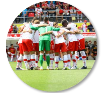
Sportlicher Neustart in der 3. Liga